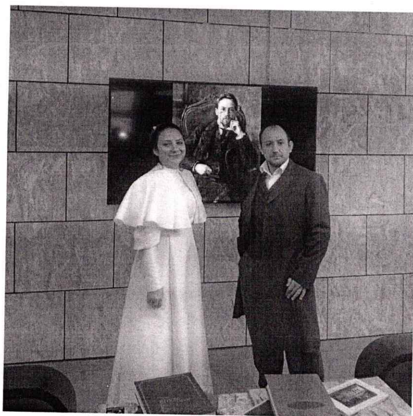
Рис. 1. Визитная карточка нашего проекта