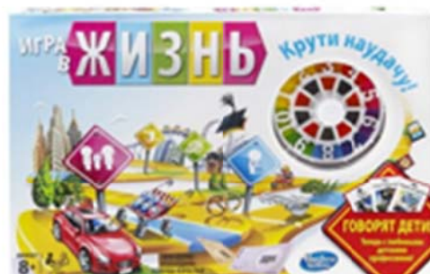
Рис2. Оформление «Игры в жизнь»

Расстояние, на которое игрок может продвинуть свою фишку определяется броском игральной кости. Обычно в игре присутствуют дополнительные правила, дающие выгоды или наказания игрокам, чья фишка попала на определённое поле. Простое передвижение по маршруту не очень интересно, поэтому свою игру мы усложнили, взяв за аналогию игру «Игра в жизнь».