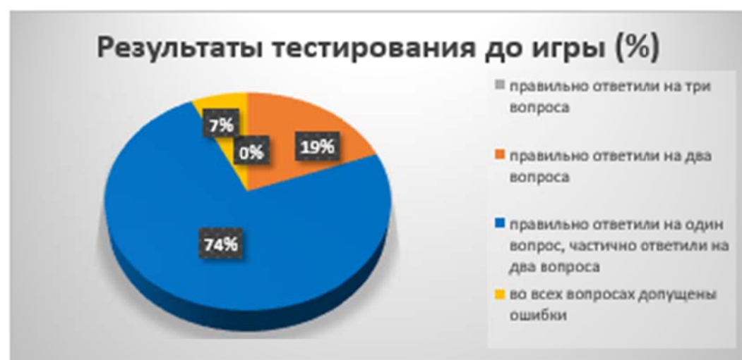
Рис.3. Результаты тестирования до игры

Во всех вопросах допущены ошибки – 7%(2 человека)