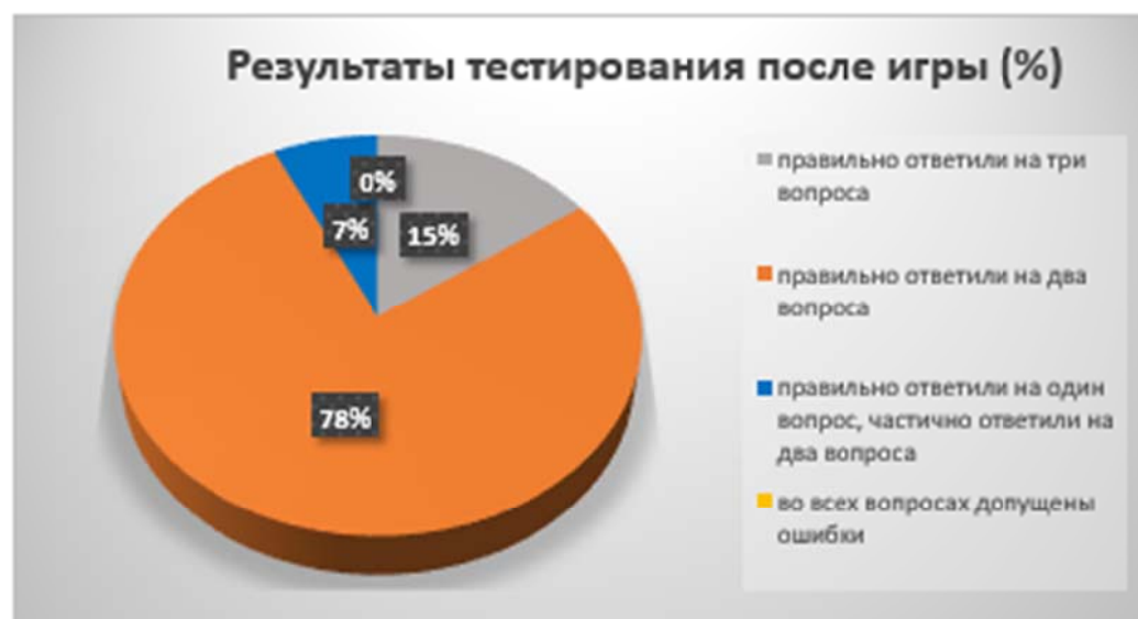
Рис 4. Результаты тестирования после игры

Конечно среди опрошенных были только ученики пятого класса и нельзя с уверенностью сказать какие были бы результаты у взрослых, но игра показала, что она значительно повышает уровень экономических знаний учащихся. Эту игру можно использовать на занятиях кружка «Финансовая грамотность», в ходе летней практики в классах социально-экономического профиля и просто дома с друзьями, так как, по отзывам игроков, наша игра «Московский бюджет» достаточно азартна.