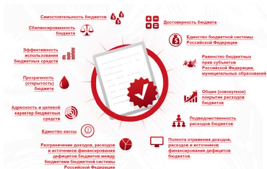
Рис 1. Принципы бюджетной политики.

На портале «Открытый бюджет города Москвы» есть брошюра для граждан «Путеводитель по бюджету города Москвы», доступная для скачивания. Она подробно и наглядной форме позволяет познакомиться с доходными и расходными статьями бюджета.