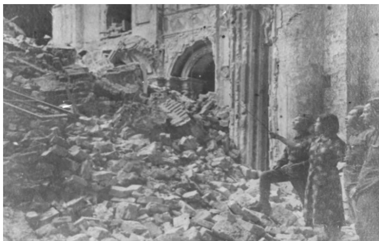
Фото 19. Первые экскурсии после оккупации. 1942 год