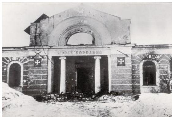
Фото 10. Подожженое фашистами здание Бородинского музея. 1941г.