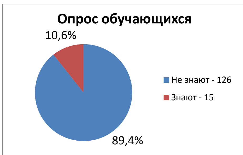
Рис. 1. Опрос обучающихся (одноклассники, юные экскурсоводы, участники Всероссийского фестиваля «Культурный маршрут»), о знании по исследуемой теме. Всего опрошен 141 человек.