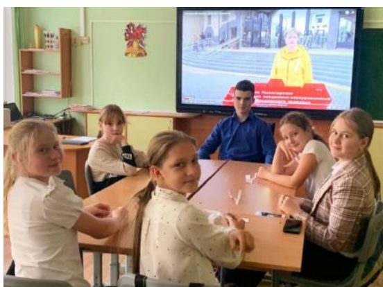
Фото 1. Автор проводит опрос на занятии в «Школе экскурсоводов»