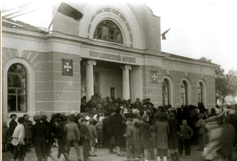
Фото 12. Афиша открытия Бородинского музея. 15 октября 1944 год