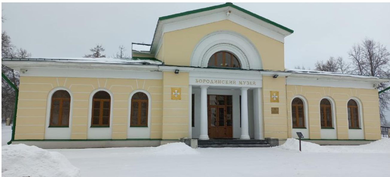
Фото 2. Музей-заповедник «Бородинское поле»