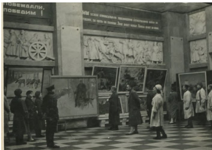
Фото 20. Дарвиновский музей во время войны