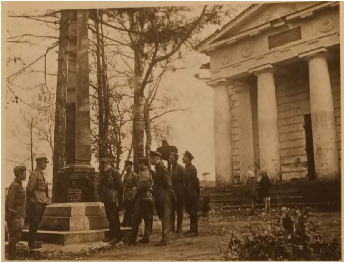
Фото 8. Участники октябрьских боев 1941 г. на Бородинском поле