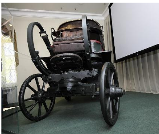
Фото 5. Экипаж Кутузова М.И.