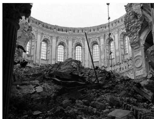
Фото 16. Музей после оккупации Фото 17. Музей после оккупации