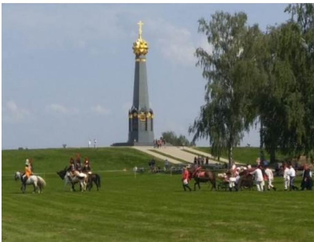
Фото 3. Военно-исторический фестиваль на Бородинском поле