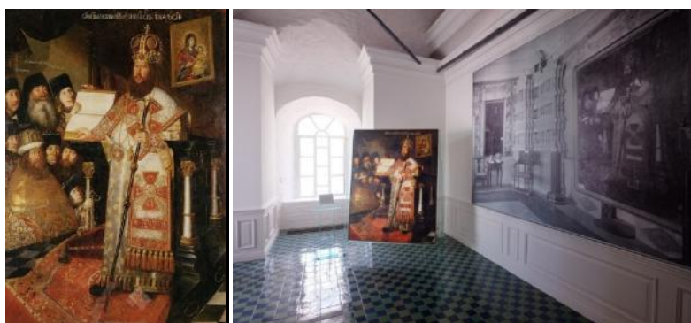
Фото 18. Неизвестный художник «Патриарх Никон с клиром» начало 1660-х гг.