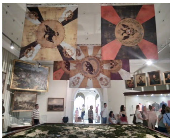
Фото 6. Спасенные экспонаты в основной экспозиции музея