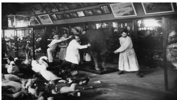
Фото 21. Перенос экспонатов на нижние этажи и в подвальные помещения музея