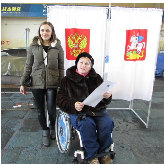
Рис.3 Волонтеры на выборах