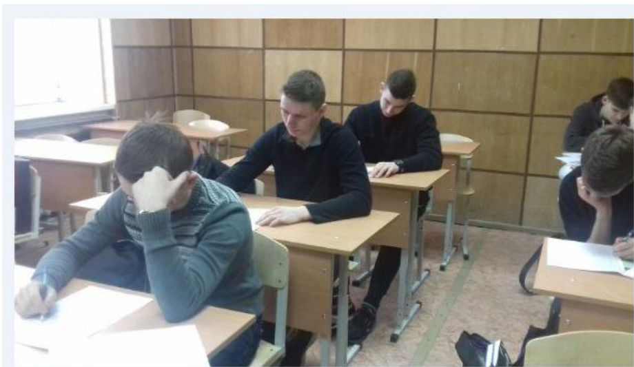
Рис.1 Анкетирование студентов