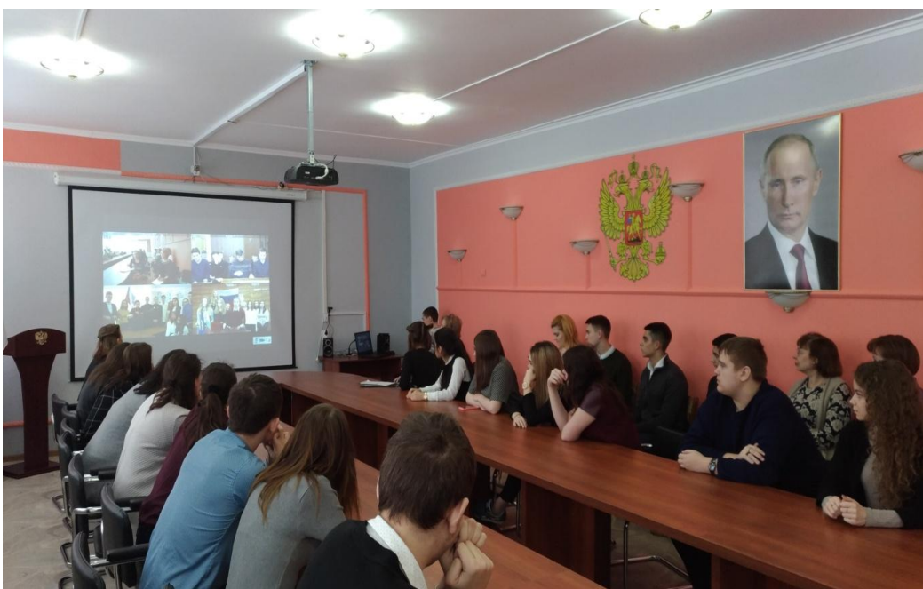
Рис.2 Участники студенческого форума в структурном подразделении №3