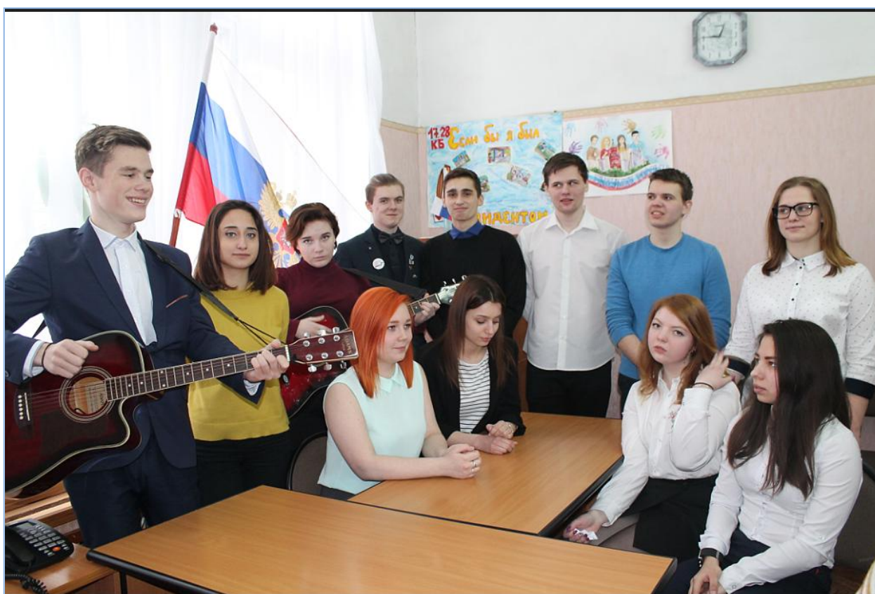
Рис5. Участники студенческого форума в структурном подразделении №1