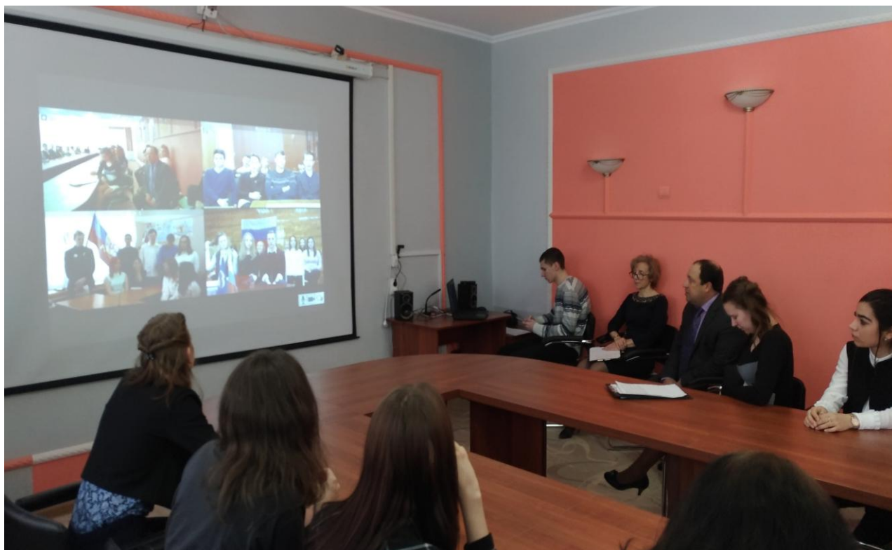
Рис 4 Телемост между четырьмя структурными подразделениями