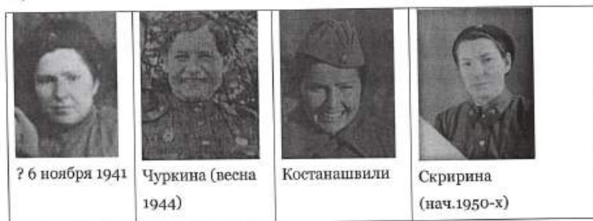
Рис.3 «Девушка в берете»?