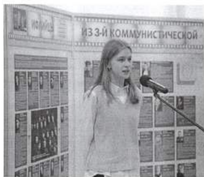
Рис.31 Выступление на открытии выставки

Созданные биографические очерки были опубликованы в сообществе ☆3 мксд☆Памяти 130 стрелковой дивизии 28 в социальной сети «ВКонтакте» и вызвали значительный интерес.