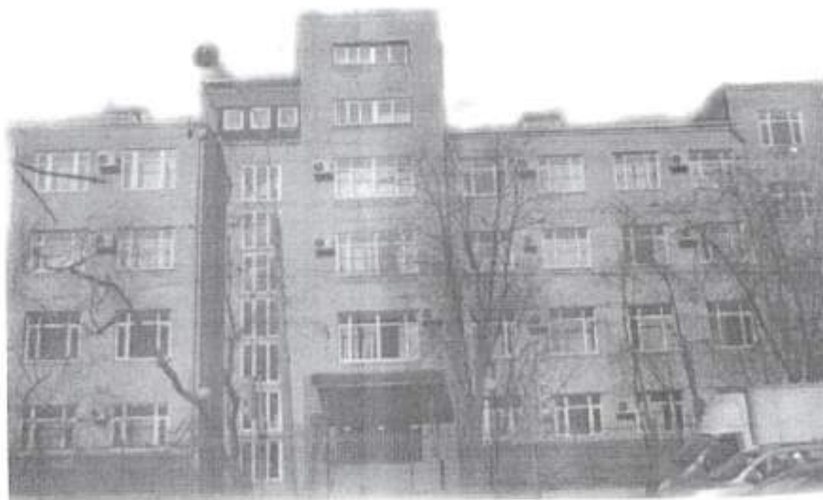
Рис.1 Ростокинский проезд, 13 а

Мое исследование началось в 2021\2022 уч.году. Тогда меня заинтересовала история здания учебного типа, расположенного по адресу «Ростокинский проезд, 13 а».