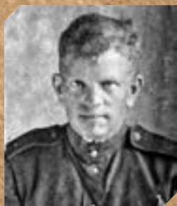
Киселев Петр Григорьевич