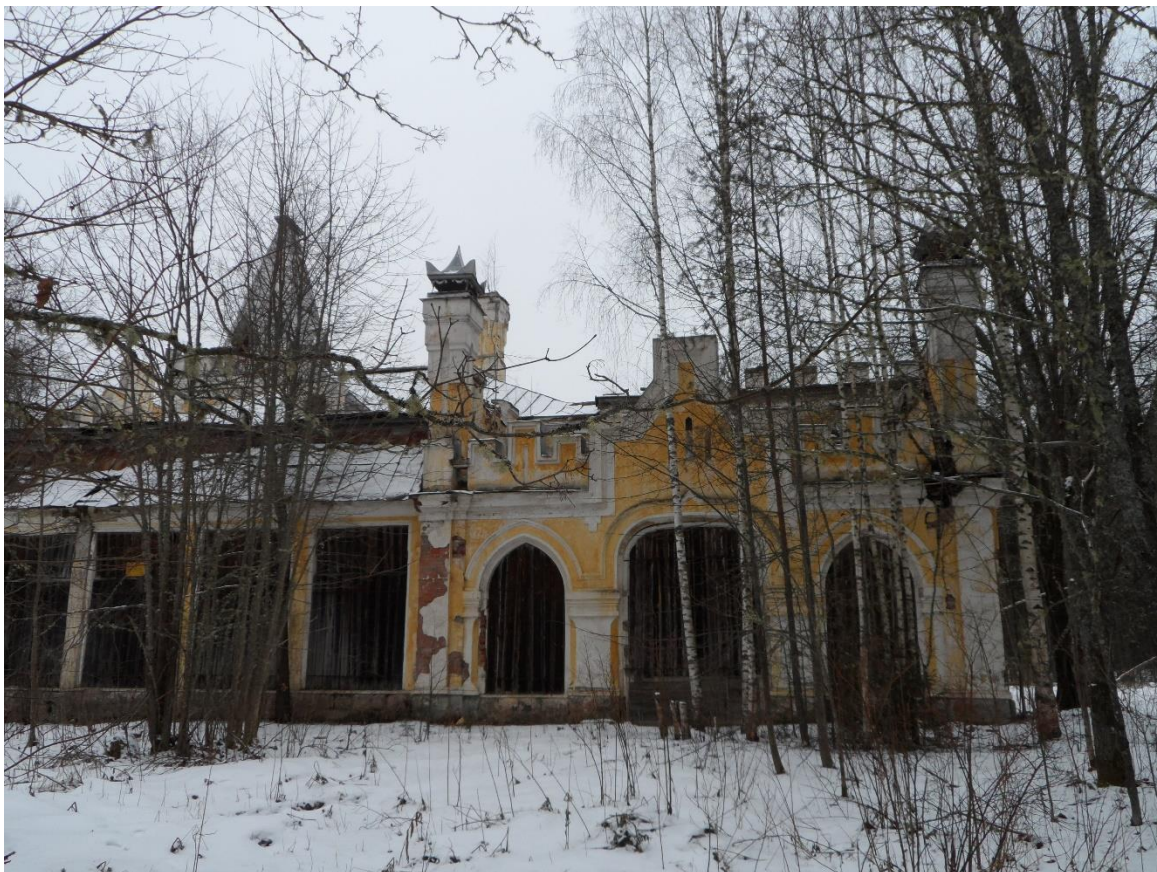
Рис. 7. Усадьба с Южной стороны