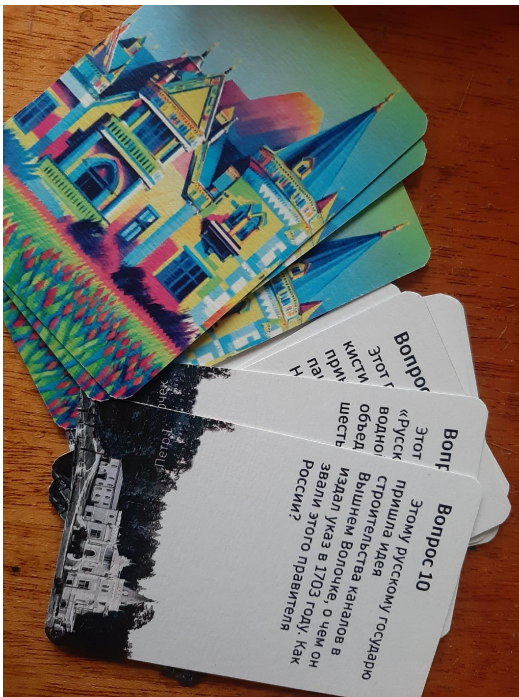
Рис. 16. Краеведческая викторина