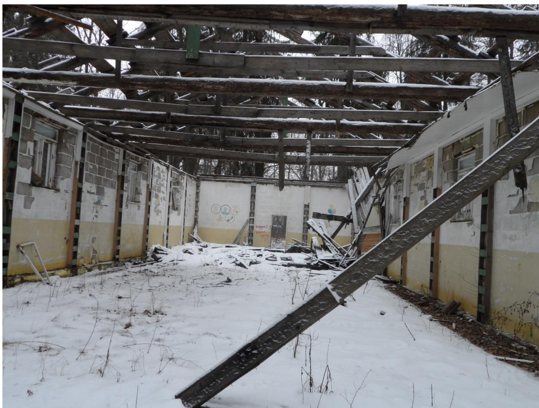
Рис. 14. Бывший кинотеатр