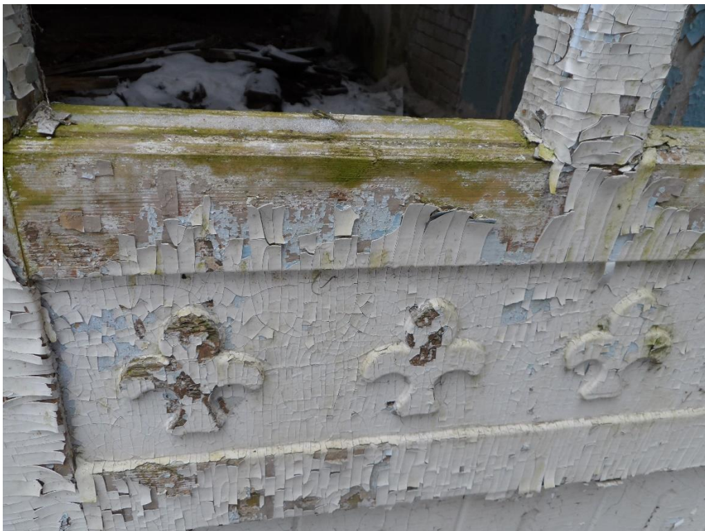
Рис.11. Элементы декора