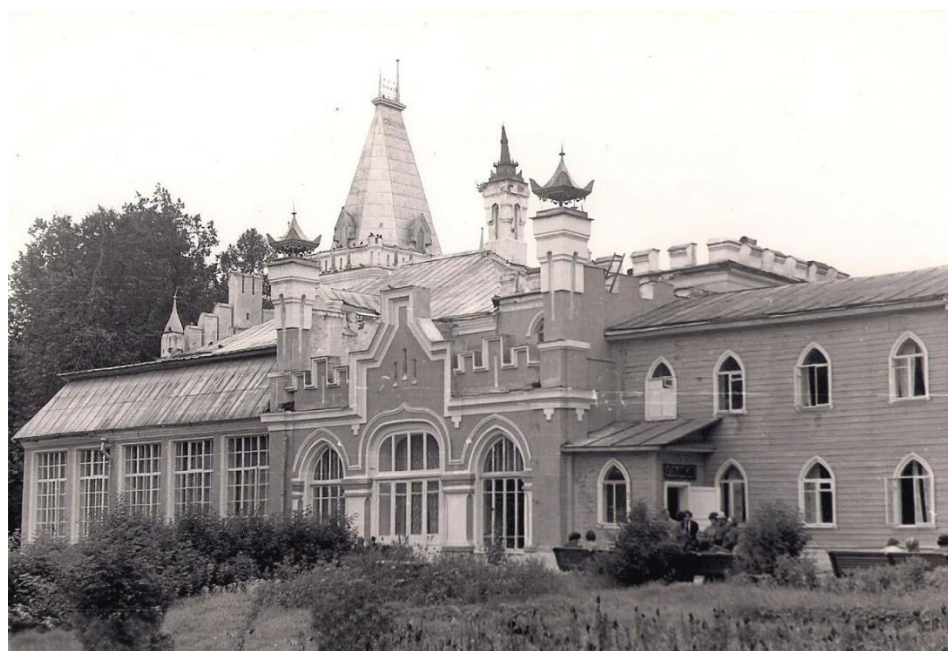
Рис.2. Усадьба генерал-майора Сназина (фото 1979-х годов)