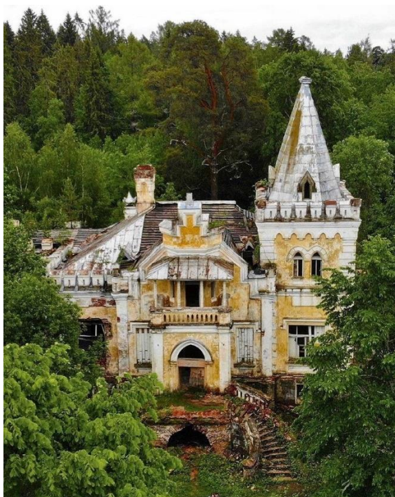
Рис. 3. Усадьба генерал-майора Сназина