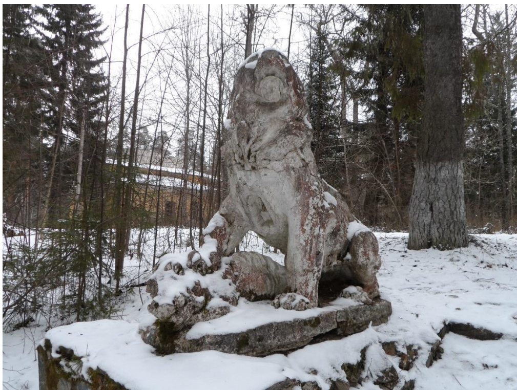
Рис.15. Лев, попирающий кабанчика.