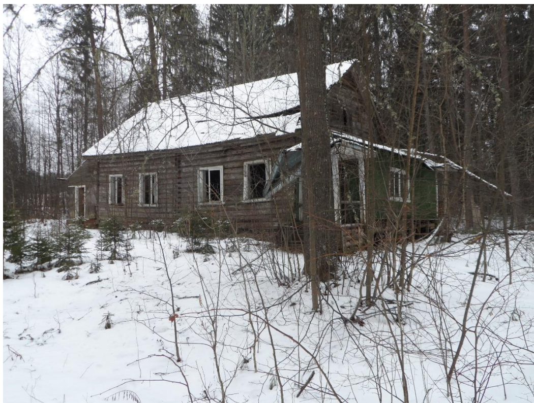
Рис. 13. Бывшая «Амбулатория»