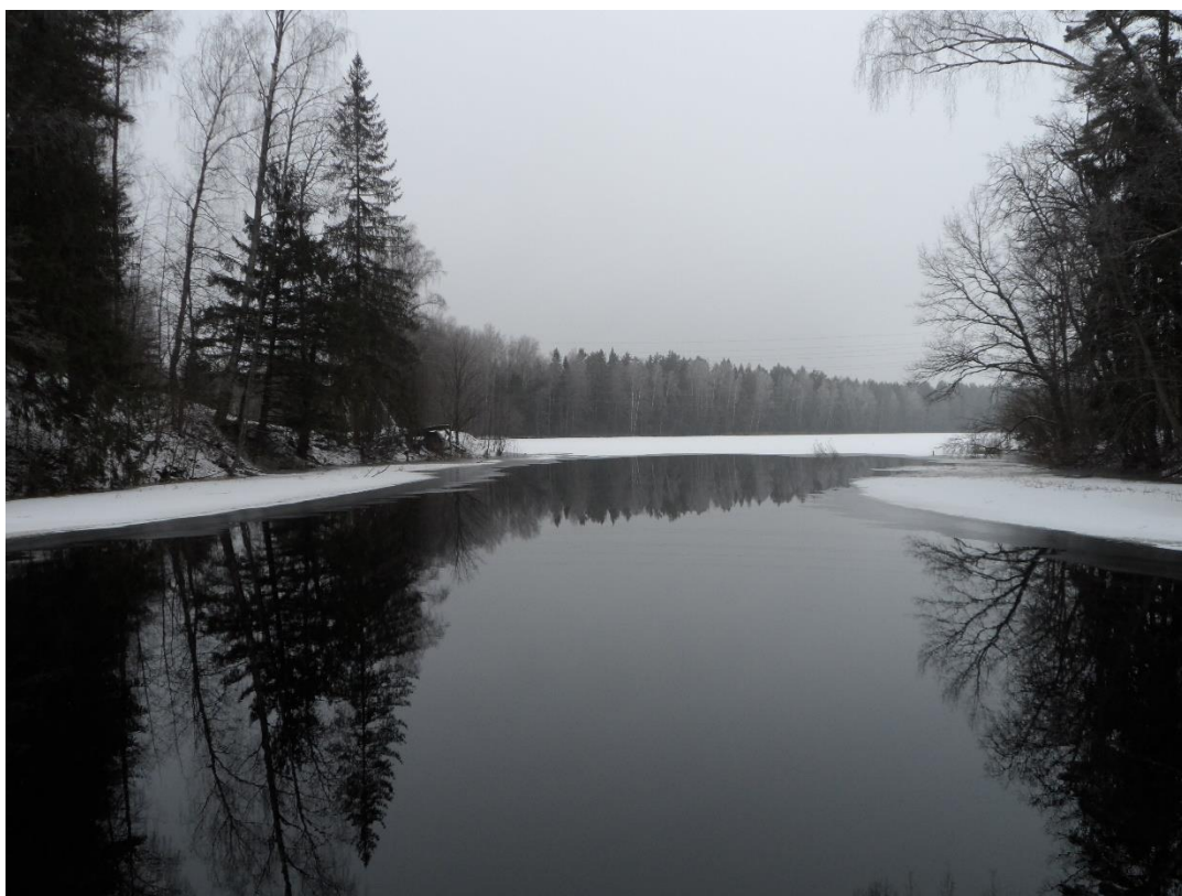
Рис. 12. Река Волчина