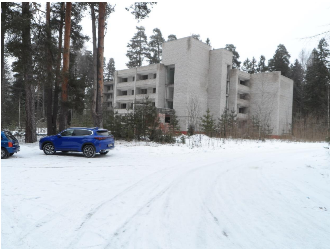
Рис. 5. Зброшенныя новыя корпусы