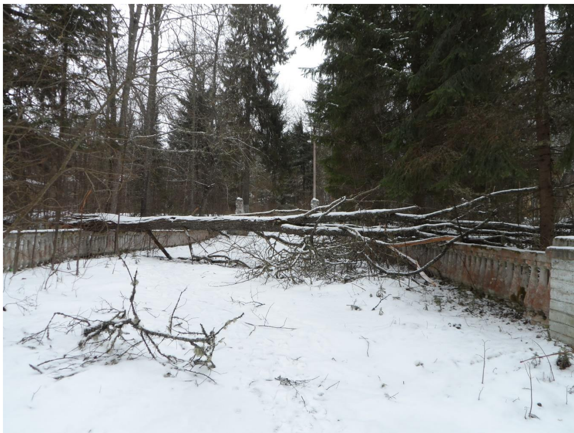
Рис. 6. Пваленнае дрэва