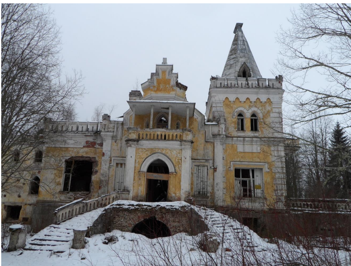
Рис. 8. Усадьба. Центральный вход