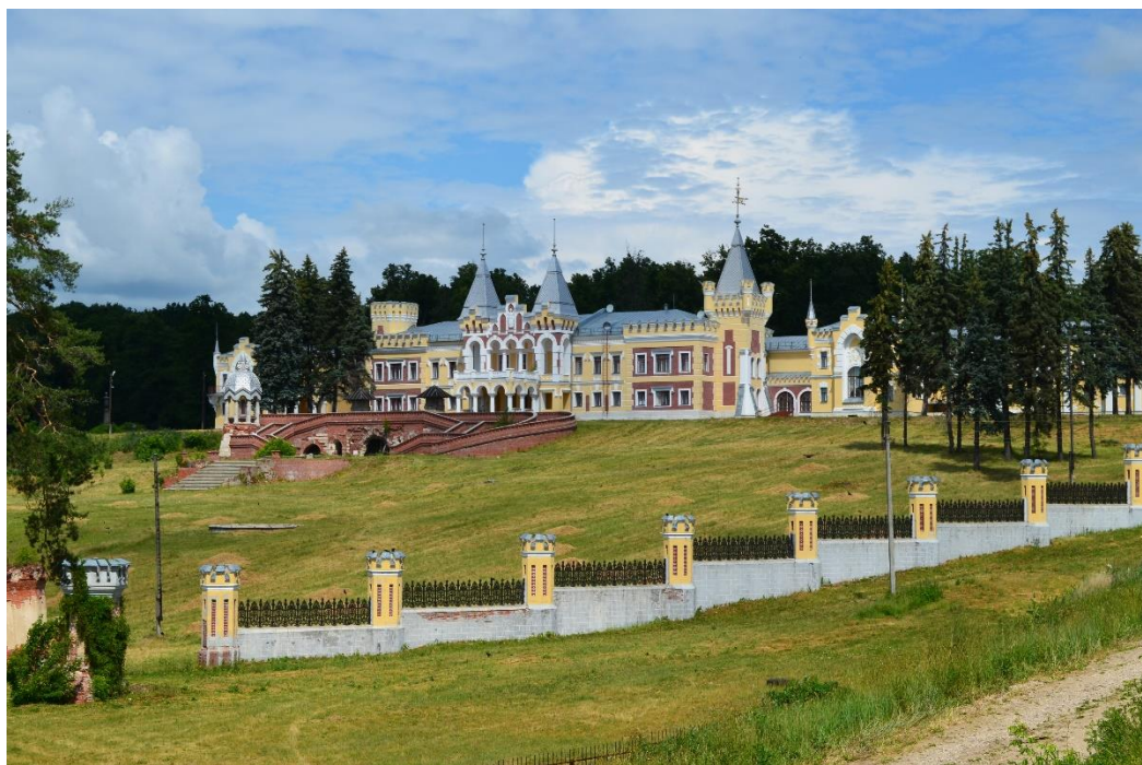
Рис. 17. Восстановленная усадьба фон Дервиза