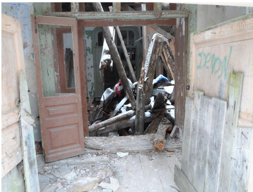
Рис. 9. Внутри усадьбы