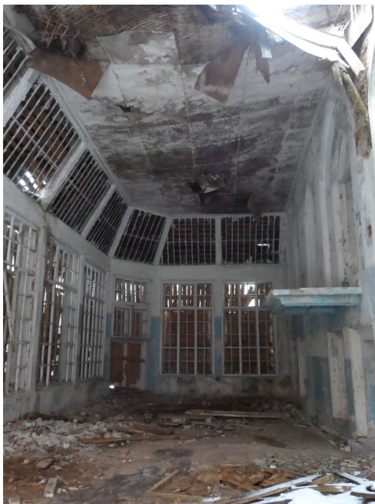
Рис. 10. Оранжерея (зимний сад)