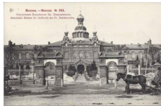
Дореволюционная открытка. Сокольники. Богадельня братьев Бахрушиных

В 1885—1887 годах на Сокольничьем поле по проекту архитектора Б. В. Фрейденберга (при участии архитектора М. Н. Чичагова) была выстроена больница на 200 коек. Такого масштабного медицинского проекта в России еще не было. В больницу для страдающих неизлечимыми заболеваниями принимали людей всех сословий и вероисповеданий, лечение было бесплатным.