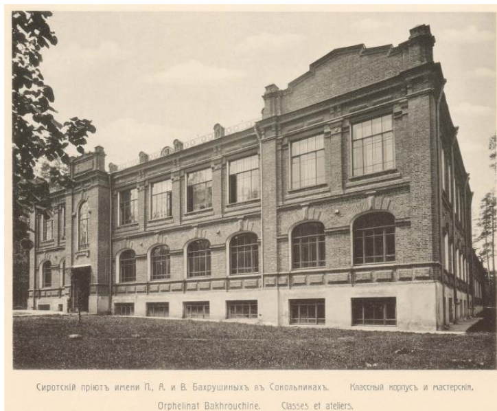
Рис. 6. Московский городской приют имени братьев Петра, Александра и Василия Бахрушиных

Место под приют было выбрано не случайно, все было максимально продумано для жизни детей: юго-западная оконечность огромного лесного массива, значительную часть его составляли деревья хвойных пород, обеспечивая чистый, целебный воздух, особенно полезный для детей. Эти места были незастроенными, приют получал достаточно места для развития, а условия позволяли детям расти в городе и одновременно на природе (рис. 6).