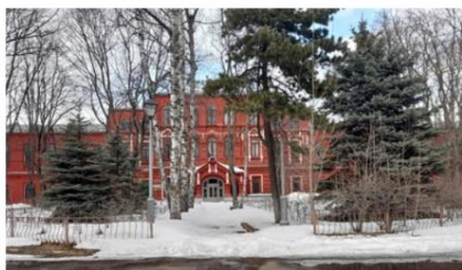
Больница имени братьев Бахрушиных. Город Москва, улица Стрмынка, дом 7, к. 1