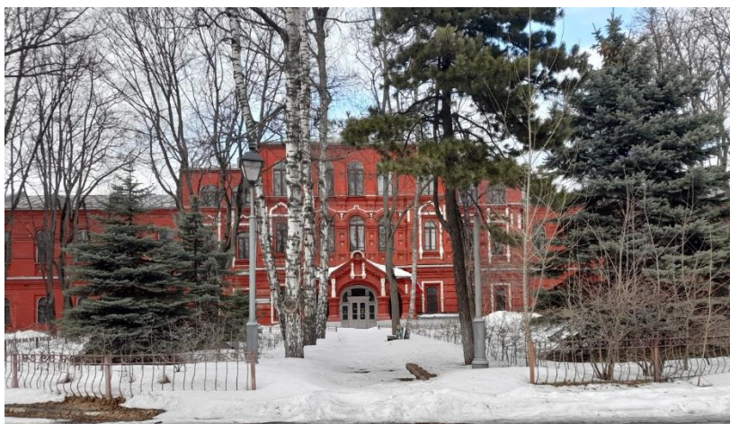
Рис. 5. Городская клиническая больница имени братьев Бахрушиных Современный вид