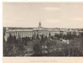
Главный корпус больницы. Фото 1913 г.