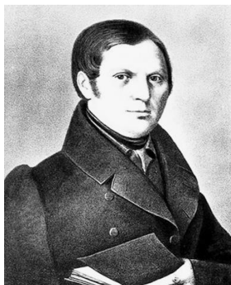
Рис. 1. Алексей Федорович Бахрушин (1792–1848)

Анализ многочисленных источников свидетельствует о том, что история династии великих российских благотворителей и меценатов Бахрушиных началась в 30-е годы XVIII века, когда глава семейства, Алексей Федорович (рис. 1), со своей женой Натальей Ивановной и маленьким сыном Петей перебрался из города Зарайска Рязанской губернии в Москву.