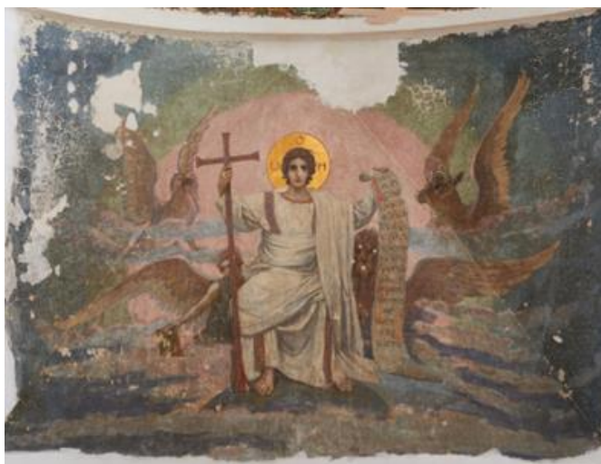
Рис. 8. Роспись Храма Живоначальной Троицы