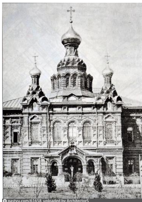
Рис. 4. Храм во имя иконы Божьей матери «Всех Скорбящих Радости»

В 1902 году при больнице был построен и оборудован самый крупный в городе родильный приют, в 1911 году – светолечебница для физиотерапевтических процедур и рентгеновский кабинет с редкой для того времени диагностической аппаратурой, через несколько лет возвели амбулаторию. 7 Согласно уставу, в больницу принимали людей всех сословий и вероисповеданий. Лечение было бесплатным; больных звали пенсионерами братьев Бахрушиных. Сюда привозили людей из богаделен, приютов, с заводов и фабрик, а также подобранных на улицах полицейскими или санитарными врачами. Так, после трагедии на Ходынском поле в 1896 году Бахрушинская больница одной из первых приняла пострадавших, сюда же доставляли раненых с московских баррикад в 1905 году.