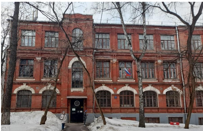
Рис. 9. Учебный корпус Сиротского приюта Современный вид, 2025 г.

учебном корпусе сегодня располагается «Бахрушин Loft» и другие организации, о чем свидетельствуют вывески на входной двери (рис. 9).