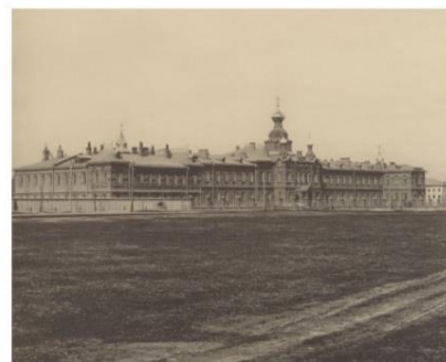
Больница братьев Бахрушиных на Сокольничьем поле